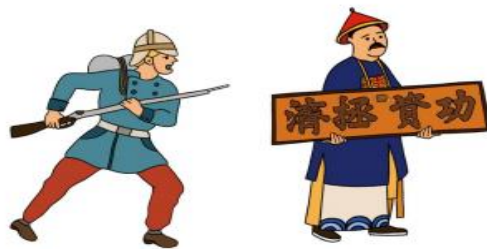
清法戰爭滬尾戰役戲台手偶

敘述 10 月 2 日炮戰的過程與「三尊神明護佑淡水」的故事，強調地方信仰如何與歷史事件交織。