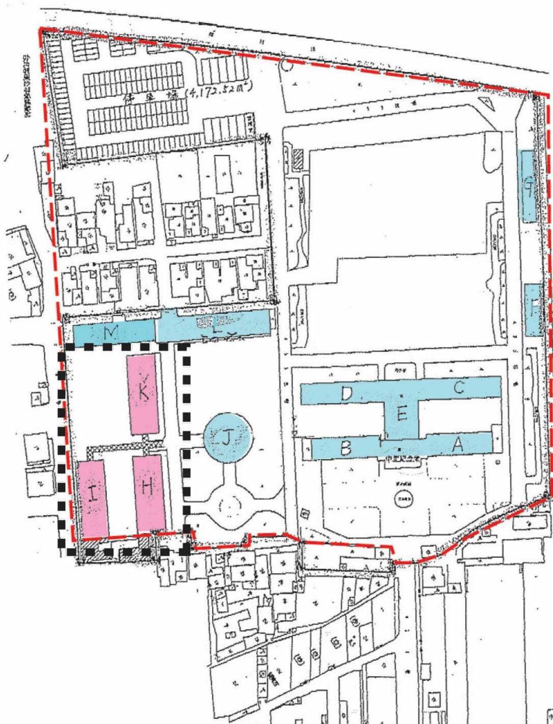
板橋435藝文特區 平面圖