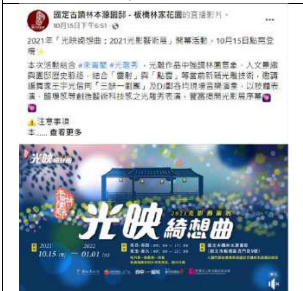
10月15日 | 開幕活動直播