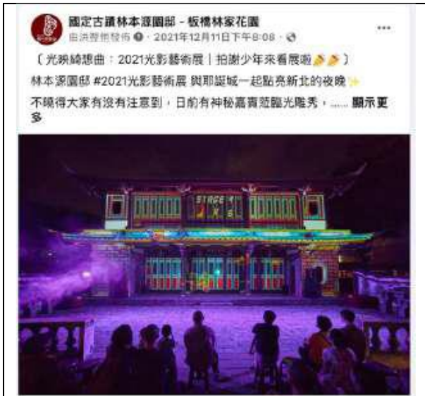
12月11日 | 樂團拍謝少年貼文轉發