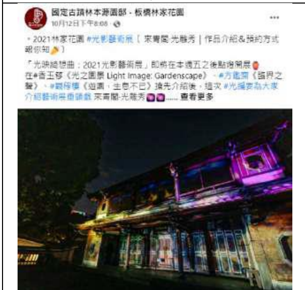
10月12日 | 來青閣·光雕秀