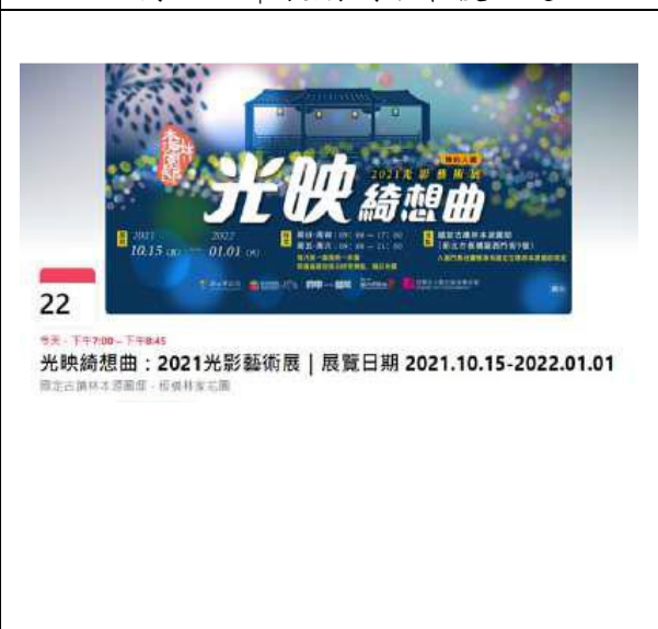
光映綺想曲：2021光影藝術展活動頁面