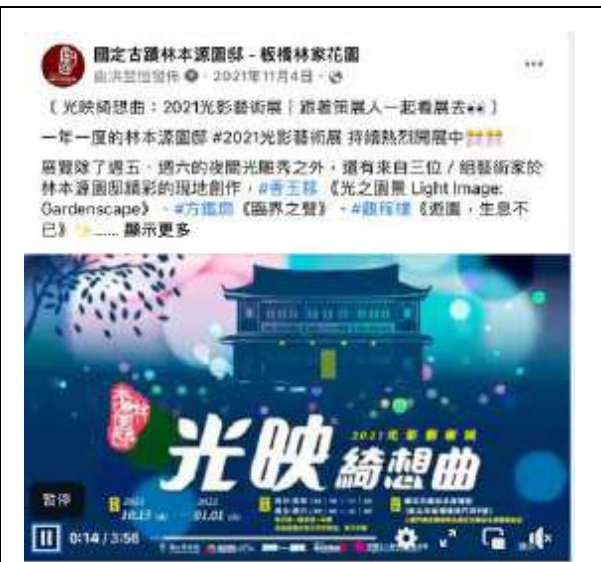
11月4日 | 策展人訪談影片