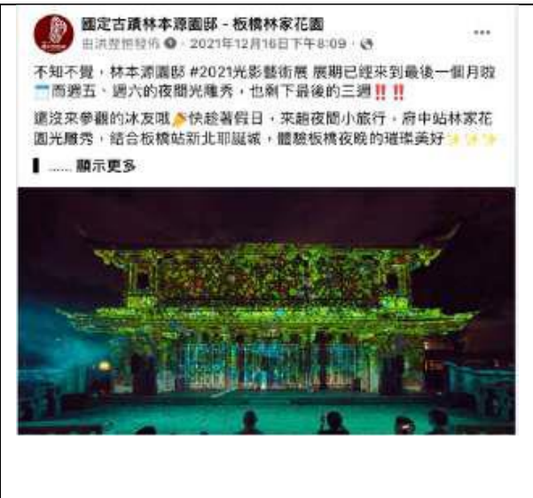
12月16日 | 耶誕城&光雕秀宣傳