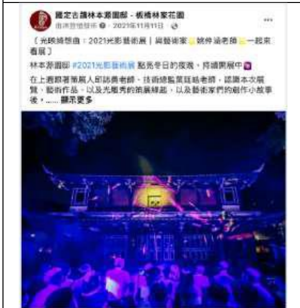
11月11日 | 藝術家姚仲涵貼文轉發