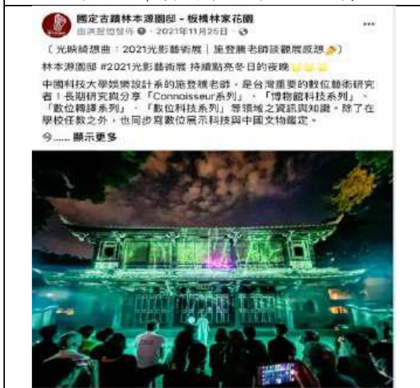
11月25日 | 中科大教授貼文轉發