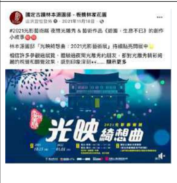
11月18日 | 遊樂製品訪談影片