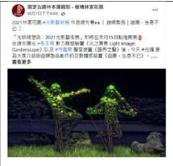
10月7日 | 遊園，生息不已