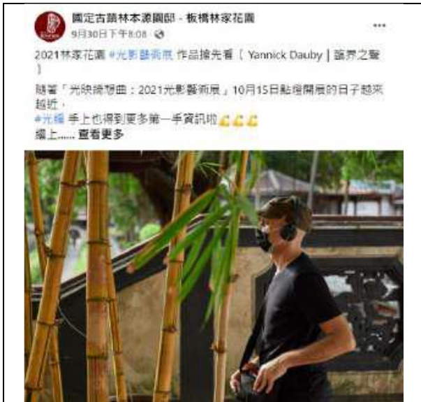
9月30日 | 臨界之聲