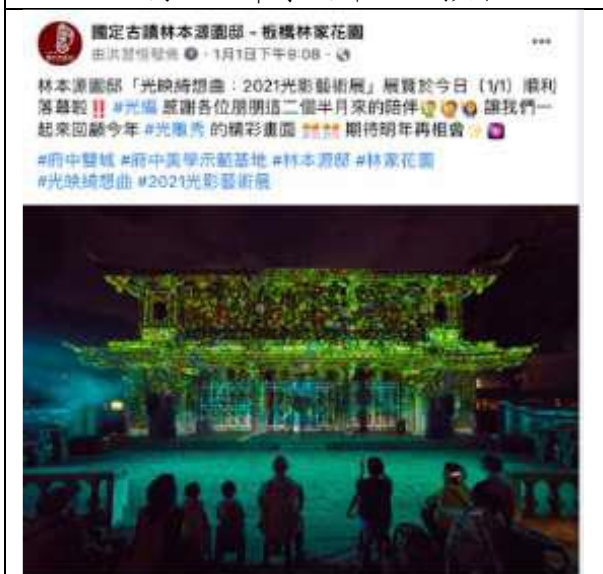
1月1日 | 閉展文