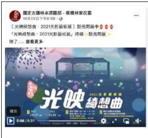
10月28日 | 正式宣傳影片