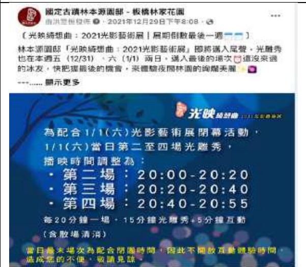
12月29日 | 展期倒數最後一週