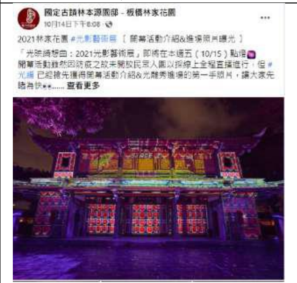
10月14日 | 開幕活動介紹