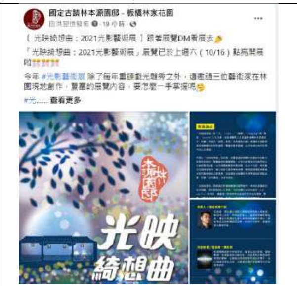
10月21日 | 展覽DM介紹