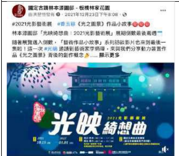
12月23日 | 李炳擘訪談影片