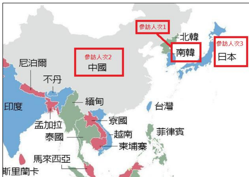
圖 2：參訪遊客國籍地圖

由地理相對位置圖結合參觀人次綜合分析(如圖 2)，可觀察出參觀人數較高的前 3 名均為我國鄰近的國家。因此認為，鄰近國家可能因地利之便，在安排家族旅遊或短期旅程時會優先考慮航程較短的我國作為目的地。且文化歷史背景相近，有共通的流行文化(如偶像劇拍攝場景、音樂MV等)也可能增加該國遊客前來參觀的人次。