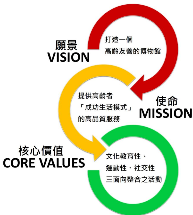
圖 1：淡水古蹟博物館樂齡活動的規劃理念

與一般博物館不同之處，淡水古蹟博物館是由古蹟群所串連起的博物館，文化資產的先天優勢讓我們在活動的設計上，能提供觀眾豐富的古蹟與文化資產教育資源，滿足文化教育性需求，再結合新北市境內各公立文化場館、特色景點、觀光工廠及地方特色美食精，專門為高齡族群所設計規劃的「樂齡一日遊體驗行程」，其特色：