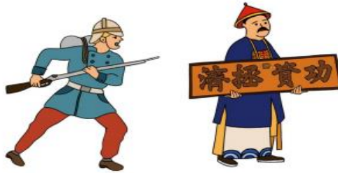
清法戰爭滬尾戰役戲台手偶