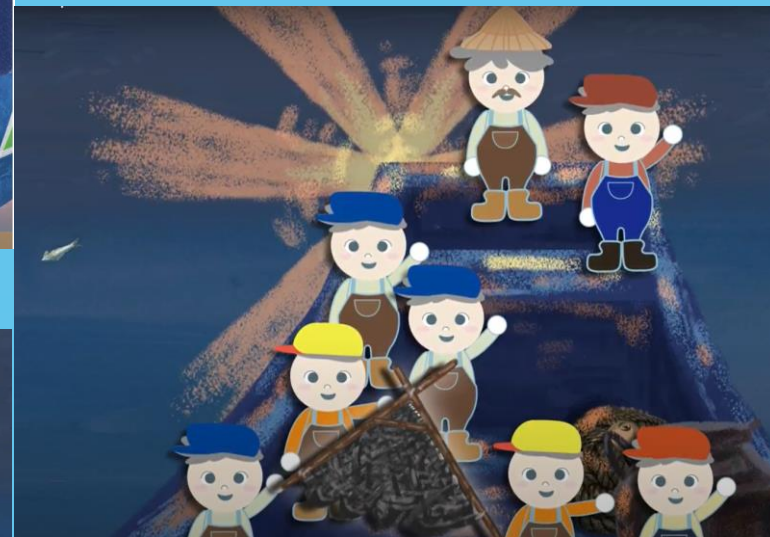
金山躡火仔夜閃閃.mp4