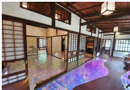
「水域台北」展覽一隅