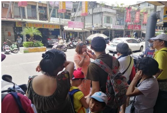
圖書館「探索南勢角華新街緬甸華僑部落」走讀活動