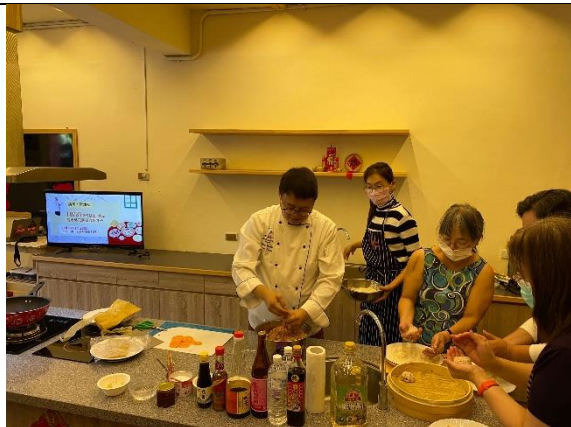
邀請知名大廚梁幼祥來現身說法