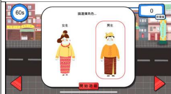
潑水遊戲角色選擇介面