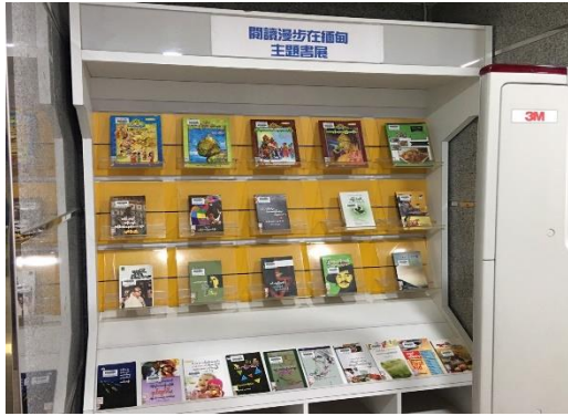
圖書館「多元文化主題書展」