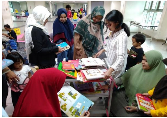
圖書館「多元主題讀書會」