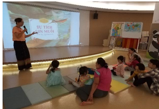
圖書館「新住民媽媽說故事」