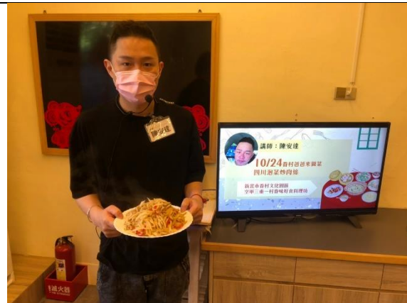
爸爸們也可以成為家中美味的掌廚者