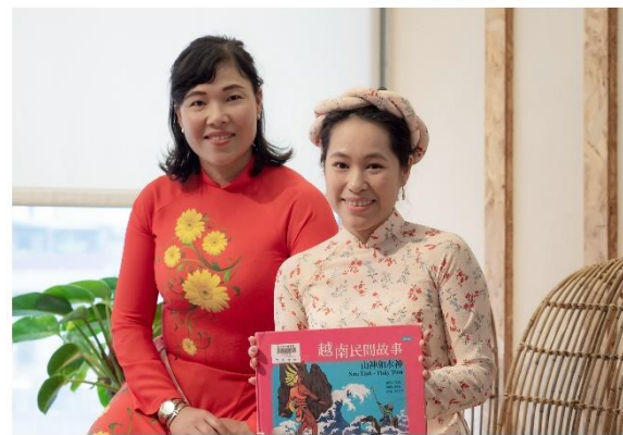
圖書館「故事聯合國」線上影音服務