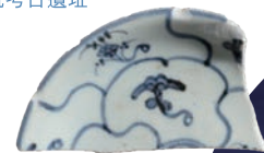
▶ 瓷盤殘件(青花, 靈芝紋) 下厝坑考古遺址