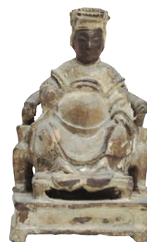
◀ 媽祖 竹木 / 寬10 厚8.5 高16.5 cm / 民初