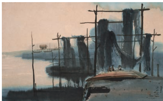
▲ 網 方延杰 西畫 / 縱84.3 橫51.7 cm / 民國

臺灣獨特的海洋文化是立足世界的重要資產，本次展覽以海洋文化為主題，結合國立歷史博物館與新北市立十三行博物館展品，以及二館藏品的研究成果，探討人類與海洋生態的關係。無論是早期的文物還是不同形式的藝術表現，都以不同的介質展現海洋的語彙，召喚著我們。藉由考古出土文物、漁業用品等器物，可以認識島嶼的誕生、外在自然環境與歷史的發展。從攝影、油畫、水墨、陶藝、木雕等藝術作品，體察藝術在海洋文明島鏈上的扮演角色和創作觀點，並提供民眾理解與觀看臺灣歷史進程的不同視角。