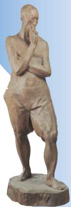
▲ 木雕「討海人」(第六號) 陳正雄 竹木 / 高104 cm / 民國

先民橫渡黑水溝，到臺灣開荒闢地，從近岸落籍生根，四百年來歐美亞各大海陸強權分別於不同年代以不同方式影響臺灣，如同拍岸潮浪，在這塊土地上激起不同的水花，也逐漸匯集成歷史洪流。歷經不同政權的更迭，群眾的交融，孕育多元的海洋文化特質，舉凡漁業文化、飲食文化、漁村文化、海岸、航海、船舶、海權、海洋文學、海洋藝術、海洋習俗及節慶等，為海洋臺灣寫下精采註解。