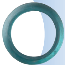
▲ 玻璃環 (本件為重要古物) 直徑10.1cm / 國定十三行考古遺址