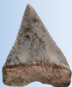
▲ 鯊魚牙 國定十三行考古遺址