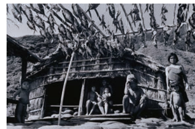
▲ 飛魚季 林權助 攝影 / 縱51 橫61 cm / 1956

希望本次經由文物、美術作品所開展的多元視野，更加體驗臺灣民眾和海的親密關係，從了解海洋、親近海洋、進而保護海洋，共同珍惜海洋賦予臺灣的豐富自然生態和文化資產。