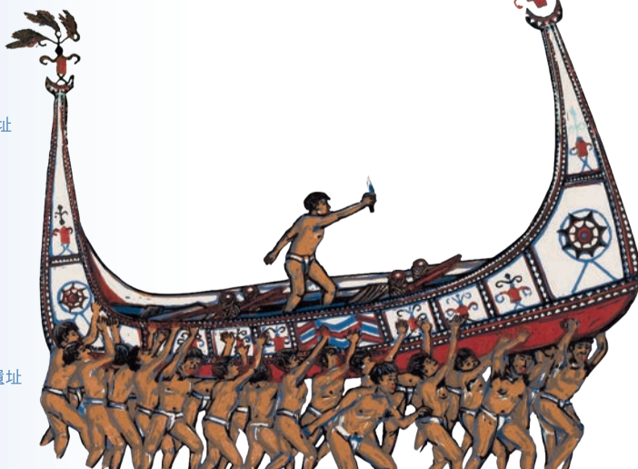
◀ 蘭嶼木舟下水典禮 (局部) 林智信 版畫 / 縱51.5 橫65 cm / 民國