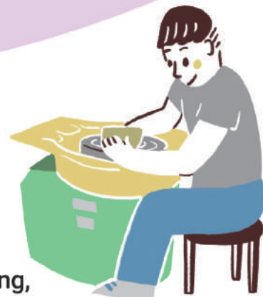
Bàn xoay gốm

Với mẫu đất sét mềm này, ngoài việc dùng tay để nặn vuốt ra hình dáng, còn có thể làm bằng bàn xoay gốm .