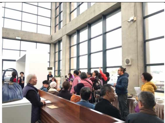
高蓮秀開幕茶會導覽