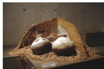
「穿越時空之旅」—— 展廳內的原住民野燒場景