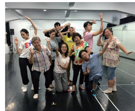
■ 淡水長老教會的學員和舞者一起排練後的合影

臺的粗獷、蒼礪。有著超過 50 歲的素人演員們，再善良、尋常不過的裝束，卻完整呈現了當今生活中，每個人都曾遭遇過的問題。在演出結束之際，天空已一片深藍，伴著若隱若現的星星，感覺礮臺沉默的經歷數百年，及淡水時間流動、更讓礮臺舊歷史場景的演出顯得讓人反思，就如同曼丁身體劇場的團名 "Mending" 所代表的意思那樣，創作對於編舞家朱蔚庭而言，是一種生命的修補，也是勇於追求人生之中美好價值的方式；對於前來觀賞自己作品的觀眾來說，她希望那是可以讓有著相同生命經驗、或是類似感受的人也能像自己一樣從中獲得抒發的力量；即使在生命經驗上沒有共鳴，最起碼也能懷抱著一種探索新事物的心情來看舞，並從中獲得樂趣。🍷