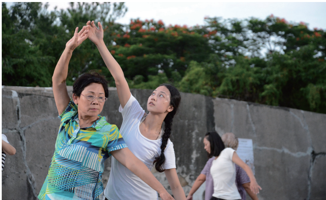
■ 舞者們和現場的素人演員一起互動

淡水古蹟上表演的構想時，學員們多表示支持，雖然一開始覺得不可能達成，但在經過四個月的訓練，經過多次彩排及不斷的累積經驗，讓他們開始適應自己的身體，展現自己肢體，更能夠依著編舞家的指導，完整的呈現演出樣貌。在淡水滬尾礮臺演出的作品更帶出來孩子成長，離家後，父母親與孩子的日常對話、經驗，帶出世代間的難以溝通、封閉的現況；以此作為一個社區學員參與的作品，將社區，生活經驗，以及專業舞者共同串連匯集的作品中，將原本嚴肅的議題，以一種很親近，及易懂的方式呈現。