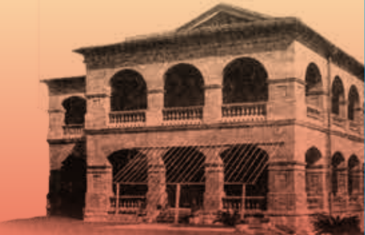
1911年淡水英國領事館官邸西南向照片，為了防曬，還置有遮陽棚架。