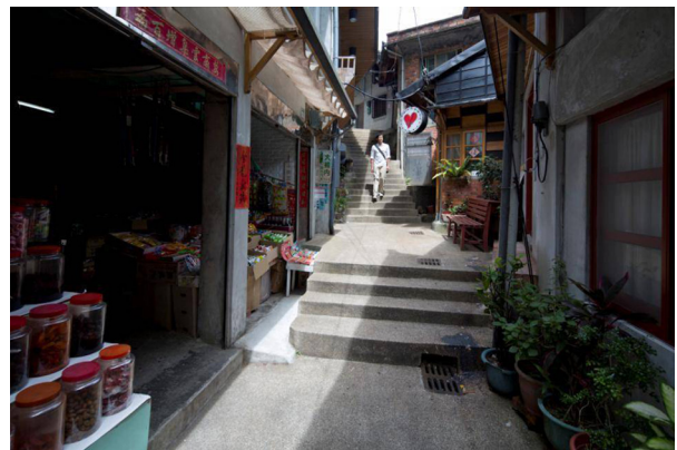
圖 4 2012 下半年年度特展礦山紙上電影，金瓜石聚落故事場景

嘗試將金九區域型的文化資產，結合在地社區的故事，用微電影的手法，將「水金九礦業遺址」的空間角落美學，透過攝影、說書故事的手法串連，讓遊客結合自身的生活經驗，與在地居民的生活串連互動。在籌設展期間從發現在地的故事、田野調查、探勘、口述歷史與社區居民館員的臨演串場，過程中館方與社區的互動及開展期間與遊客的互動的過程，都讓這礦業遺產到生態博物園區的理念逐步落實。