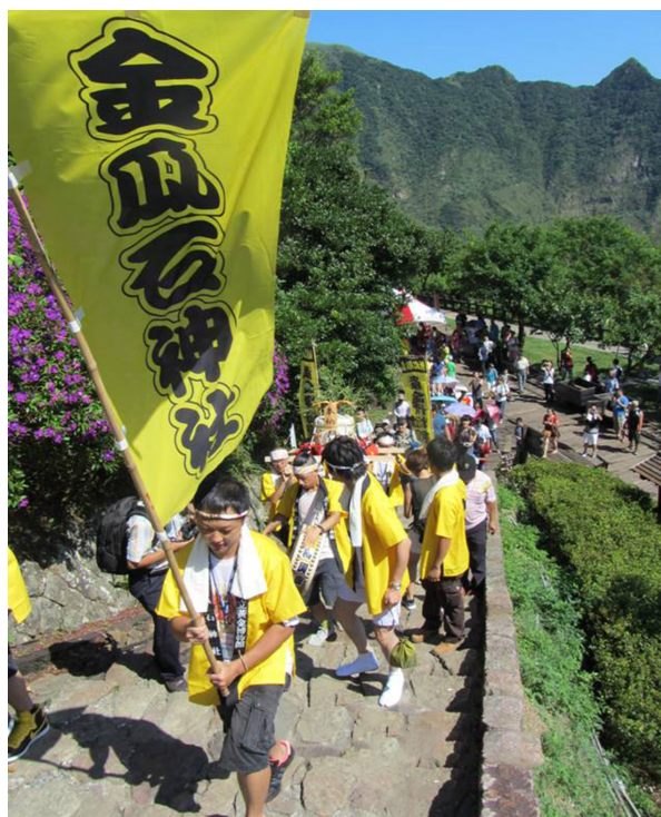
圖 2 新北市 2012 義起結緣尋訪金瓜石神社活動

結合在地勸濟堂祭拜關公，的歷史人文背景精神配合在地舉辦之「關公節」時節，利用市定古蹟「金瓜石神社」遺址，讓遊客自發邀同麻吉、粉絲團、好朋友、同學會一同參與，嘗試恢復當時神社榮景，避免因害怕引發仇日、日本殖民時期皇民化運動產物負面資產形象，而長期閒置的文化資產，並計畫於每年寒假過年期間辦理全家祈福攀登神社、暑假一起結緣尋訪金瓜石神社。