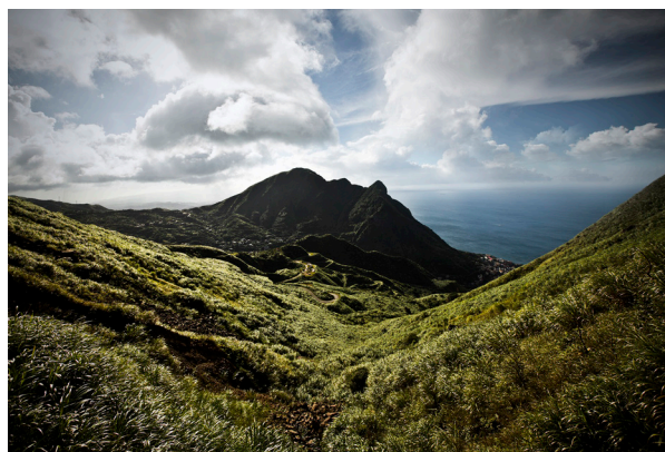
圖 1 基隆山南北稜線與金、九聚落

1896 年間，臺灣總督府頒佈「臺灣礦業規則」，為了掌握金區及礦權，將金九地區依基隆山之南北稜線（圖 1），劃分為瑞芳（九份）礦區由藤田組獲得礦權及金瓜石礦區由田中長兵衛獲得礦權；也因為兩礦區經營管理不同，產生後來兩大聚落發展完全不相同。金瓜石礦區一直處於日本人所經營，雖然在規模及產量上較豐富於瑞芳（九份）礦區，但是熱鬧程度卻遠不及九份地區，以下就兩聚落予以概述：