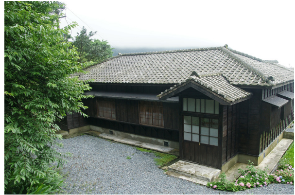
圖 3 二連棟日式宿舍單元，提供創意樂活家提出計畫申請

再現日式建築寧靜悠閒氛圍，具體營造日式宿舍空間之樂活生活型態，提供創意家申請來博物館駐村，結合文化種子與藝術家駐村的概念，廣邀國內外藝術、創意樂活家進駐於二連棟日式宿舍群中，體驗「水金九礦業遺址」的養分，並於每梯次創意家中，特別歡迎廣義媒體、部落客、旅行家等文字工作者一同參與，並與當地的社區藝術家、遊客互動，期待未來的創作能融入在地的元素。